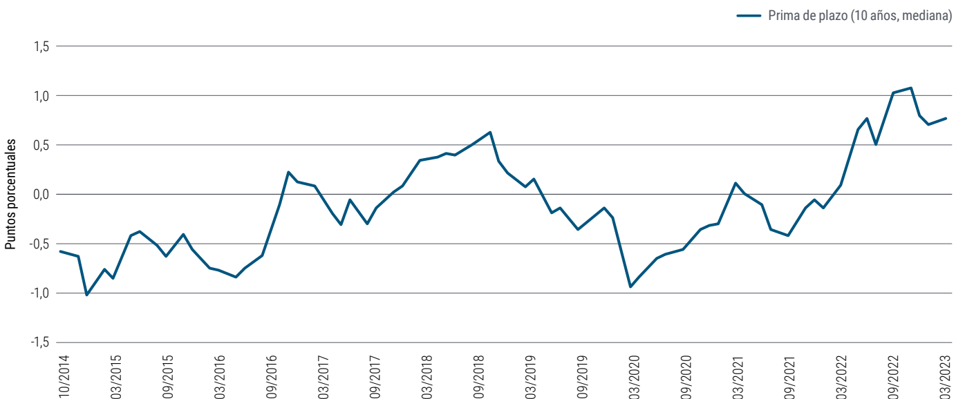
Gráfico 3: La prima de plazo del Tesoro estadounidense a 10 años sigue elevada y es probable que aumente

Por su parte, la eurozona ha superado las distintas disrupciones y pruebas de estrés con relativo éxito, juzgado en términos de la estabilidad de sus mercados de deuda soberana, en comparación con las continuas crisis de hace una década. Esto responde, en parte, al rol del Banco Central Europeo y a un conjunto de herramientas fiscales más coherente para lidiar con los shocks macroeconómicos.